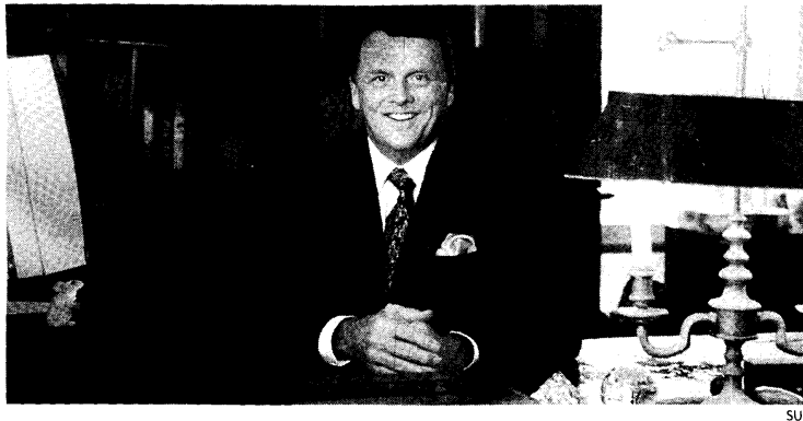
El escritor Spencer Johnson, en su despacho.

—Después de sus libros, han aparecido muchos en la misma línea. ¿Esto es bueno?